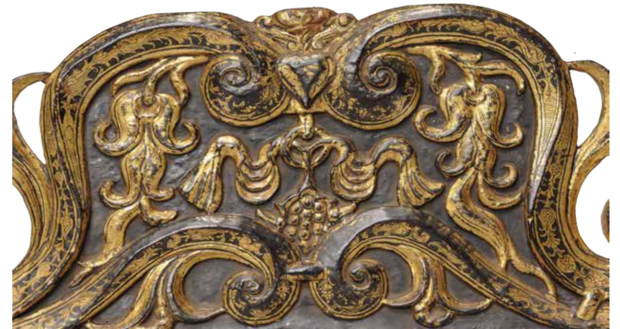
Detall de la Cadira de la Reina Badia de Bengala, Índia, finals segle XVI Cedre, laca, pa d'or i rotang MMP 115.170

La part expositiva acaba amb un subàmbit titulat "L'empremta de la Cadira de la Reina". Aquí es vol tornar a posar en valor aquest moble excepcional del monestir amb unes imatges de detall que permeten gaudir-lo i entendre'n la importància. També s'explica que gràcies al seu interès excepcional ha servit de model per a exemplars d'èpoques posteriors, fins i tot del segle XX.