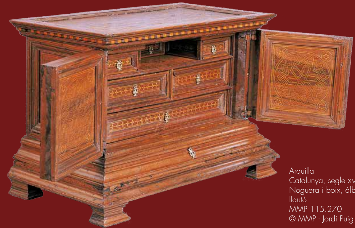
Arquilla Catalunya, segle XVI Noguera i boix, àlber als interiors i llautó MMP 115.270

La peça de guitarra 12 diferencias de Mari-Zápalos , del compositor mallorquí Francesc Guerau (1649-1717), ambienta la sala, tot recordant la importància d'aquest instrument a la ciutat de Barcelona i el fet que el primer mètode de guitarra d'Europa, de 1596, s'atribueix a J. C. Amat.