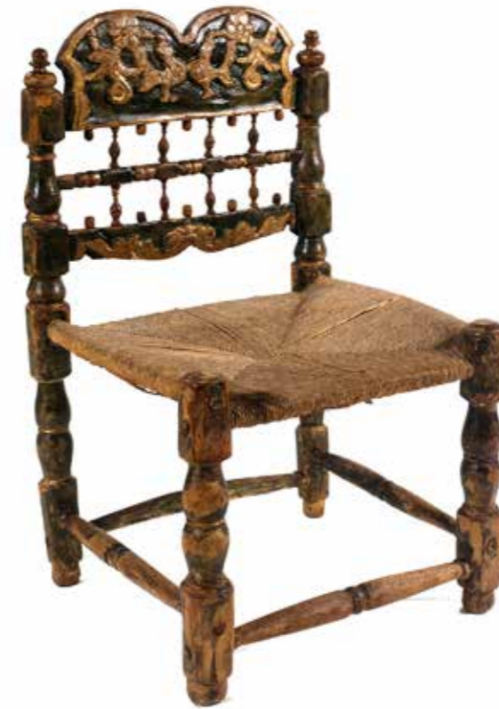
Cadeira baixa de dona Catalunya, segle XVII Fusta de ribera policromada i boga MMP 115-173_002

En realitat, tot aquest espai de "Les dones també seuen" està dedicat al seient, se n'hi mostren diferents tipologies i models i se n'expliquen les diferències. A més, un audiovisual mostra l'ús protocol·lari d'aquest moble al retrat de cort dels Àustries.