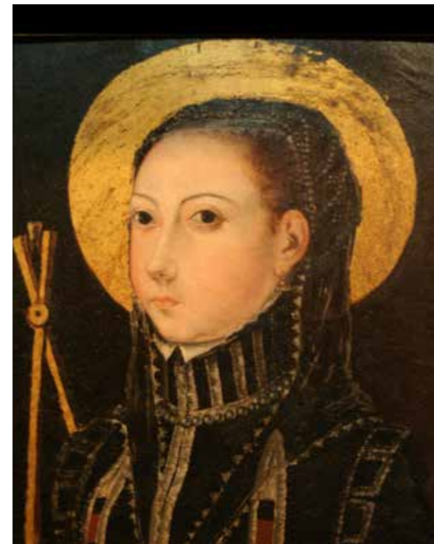
Santa Apol·lònia, mitjan segle XVI, part del retaule factici. Oli sobre taula MMP 115.043