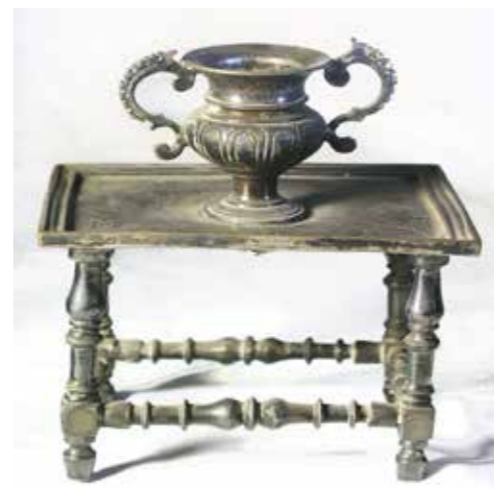
Candeler Castella, segle XVII Plata Fundación R. Pla FOM 1873 © F. Pla - M. A. Alarcia