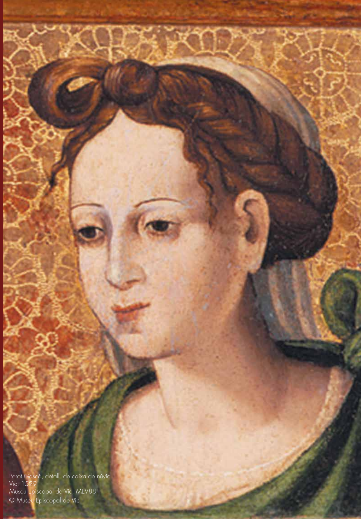
Perot Gascó, detall de caixa de núvia Vic, 1529 Museu Episcopal de Vic, MEV88

Per apropar el públic als interiors femenins, la comissària, experta en mobiliari, ha volgut posar en relació els mobles amb altres peces que configuraven l'univers femení de l'època. Els objectes ens permeten conèixer com era la vida en els interiors domèstics, un àmbit en el qual les dones s'esforçaven a mantenir l'ordre social.