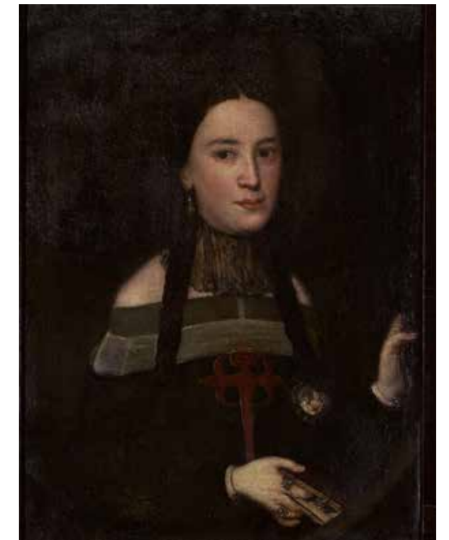
Retrat de dama amb creu de Sant Jaume, segle XVII. Oli sobre tela. NR: 2305