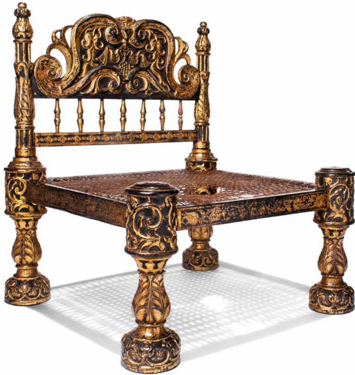
Cadira de la Reina Badia de Bengala, Índia, finals segle XVI Cedre, laca, pa d'or i rotang MMP 115.170

És aquí on s'exposa la Cadira de la Reina, una cadira baixa de finals del segle XVI procedent de la badia de Bengala, a l'Índia portuguesa, testimoni dels primers mobles orientals arribats a Europa. No sabem com va acabar al monestir, però la seva presència no és estranya, tenint en compte la successió de visites reials i les relacions familiars d'algunes monges amb l'entorn de la monarquia.