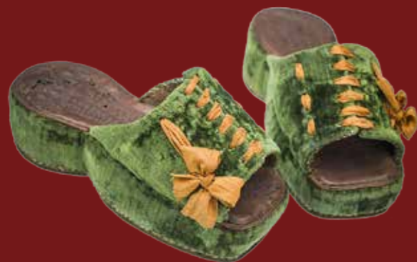
Tapins Catalunya, 1500-1550 Vellut, seda a la cinta, fil d'argent a les borles, cuir i suro MTIB 88.434