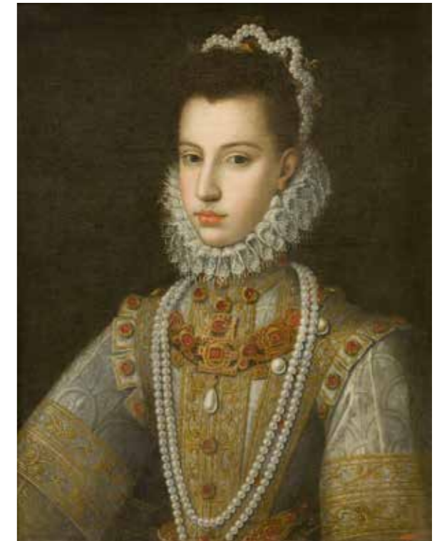
Sánchez Coello, retrat de la infanta Catalina Micaela, 1582-84. Oli sobre tela MNAC 050500-000