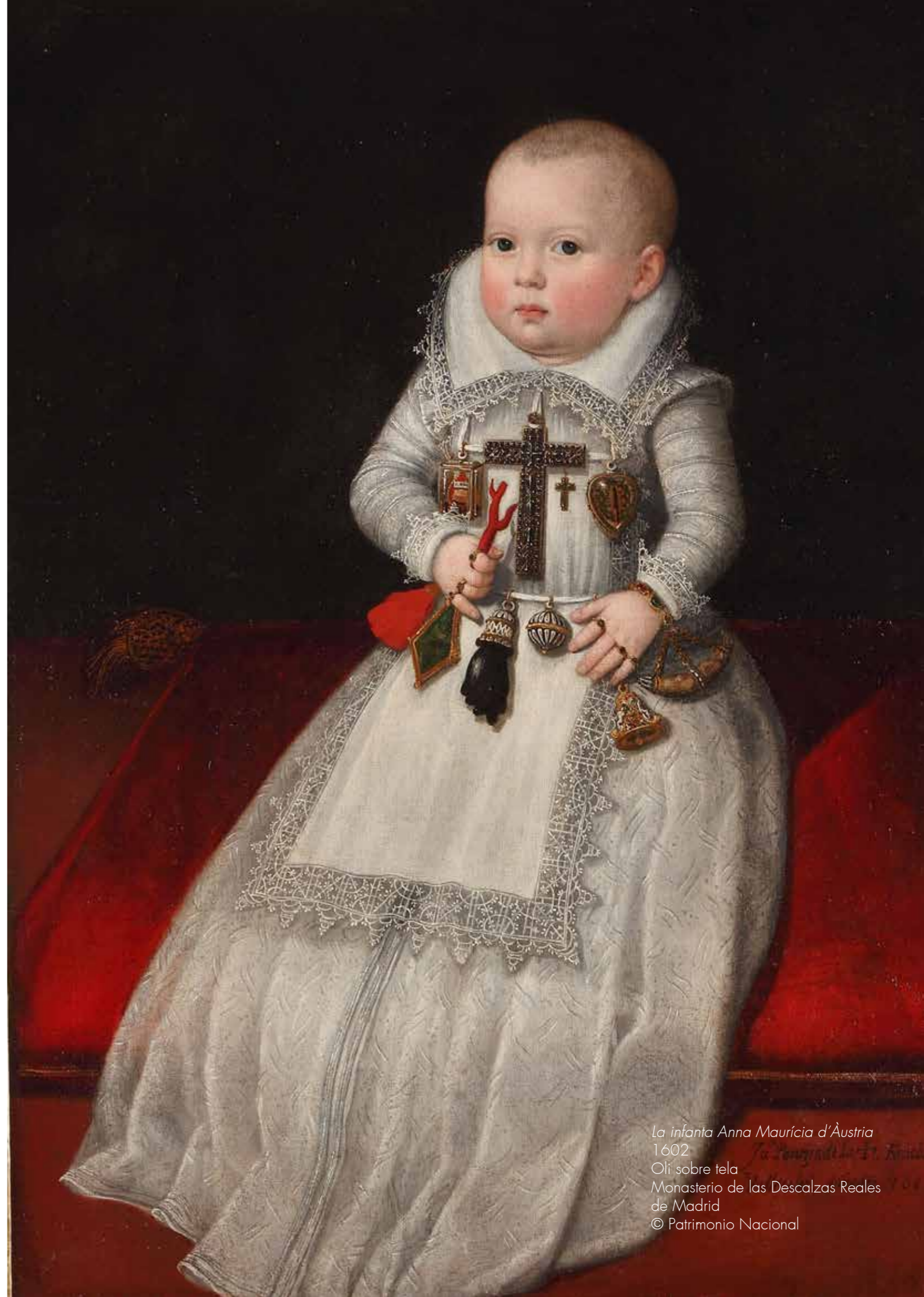
La infanta Anna Maurícia d'Àustria 1602 Oli sobre tela Monasterio de las Descalzas Reales de Madrid