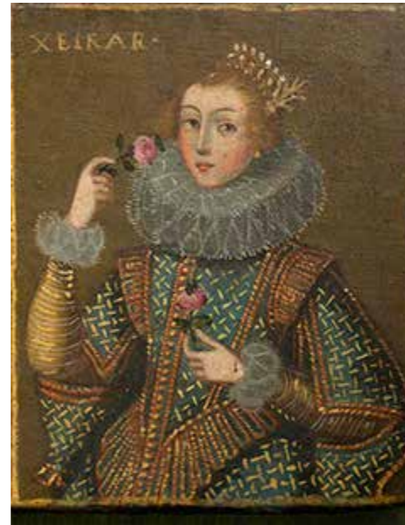
L'olfacte. Detall de joier, Portugal, segle XVII. Tremp sobre fusta NR 518

Les sales femenines benestants lluien mobles, teixits i objectes cars, alguns d'importació. La cadira baixa de dona, el bufet, l'arquilla i el mirall n'eren els mobles principals. S'enriquien amb tècniques cares, com la marqueteria, i materials d'importació, com el banús, la plata, el carei o l'ivori. El monestir de Pedralbes en conserva de procedents dels dots de les monges coristes.