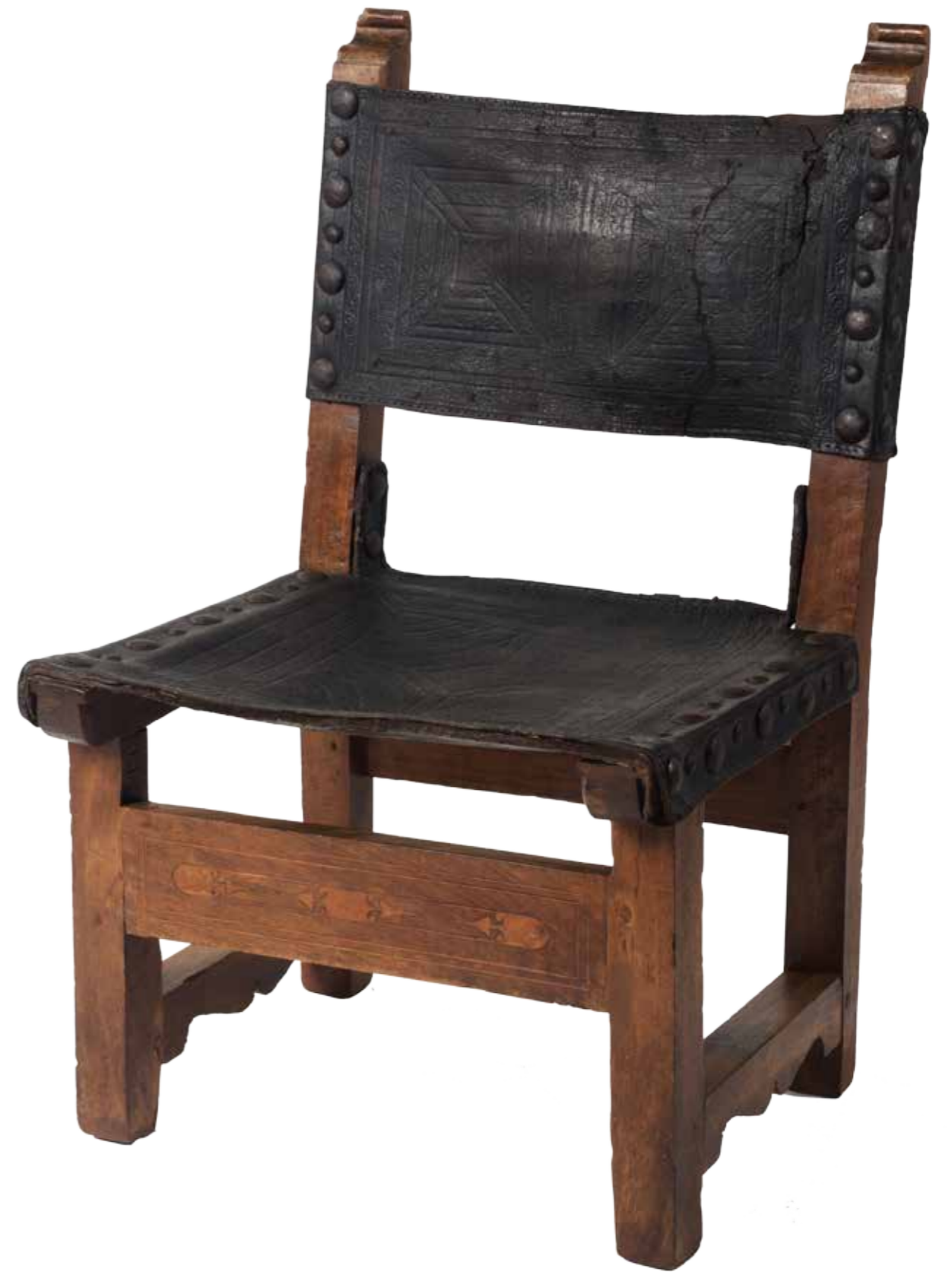
Cadeira baixa de dona Corona d'Aragó, segona meitat segle XVI Noguera i boix, cuir gofrat i ferro a les tates MMP 115.246

Les cel·les també són testimoni de la privacitat dintre del monestir i de la pràctica de la devotio moderna, més espiritual i íntima.