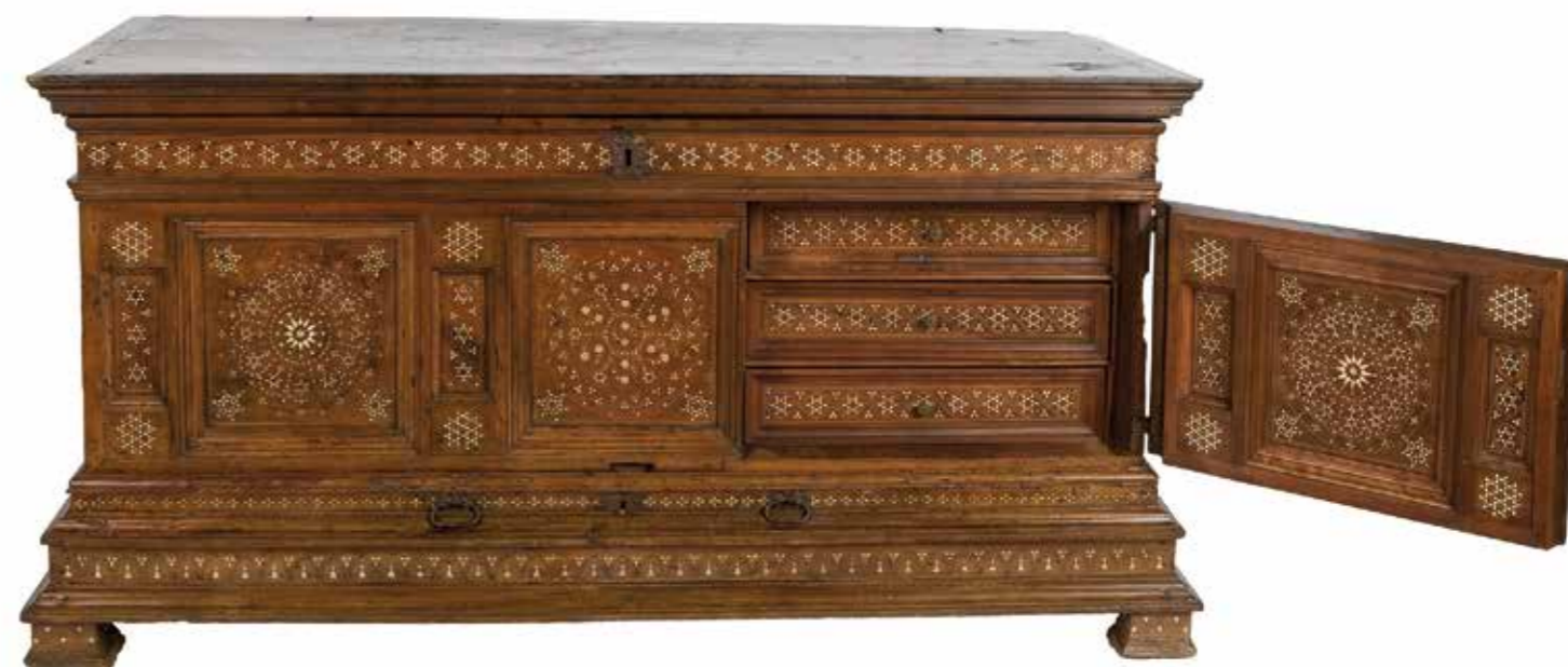
Caixa amb calaixos Catalunya, segle XVI Noguera, os i boix, i ferro MMP 115.068

Una o diverses caixes, senzilles o luxoses... el tipus de moble identificava l'estatus de la família de la núvia o la monja. Ella n'era la propietària, en feia ús i en custodiava la clau. El monestir conserva una rica col·lecció de caixes, algunes del model amb calaixos propi de Catalunya.