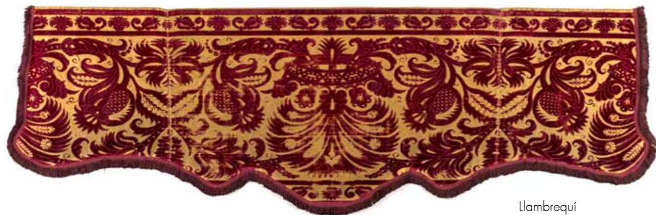
Llambrequí Segle XVI Vellut de seda bicolor CDMT 85

Dintre de la casa, el dormitori era l'espai més rellevant. S'hi concebia el fill, s'hi naixia, s'hi superaven les malalties i s'hi moria. Així, el llit era simbòlicament el moble més important i, materialment, el més car, perquè incorporava gran quantitat de teixits. Els llits més rics dels segles XVI i XVII eren els anomenats de camp , amb pilars, dosser i cortines; encara que també lluien molt els de mitjos pilars, tots dos seguint models d'Itàlia. Aquí mostrem una proposta de dormitori benestant amb peces dels segles XVI i XVII. Els objectes exposats en aquests espais s'acompanyen d'un audiovisual que presenta escenes de diferents naixements per recordar que és un acte essencial en la vida de qualsevol persona, un esdeveniment que en aquella època era protagonitzat i dirigit per dones que treballaven en equip per garantir l'èxit del part: la mare, la llevadora i les amigues o criades que feien d'infermeres. Un esdeveniment en el qual els homes no participaven fins al moment de la presentació del nadó.