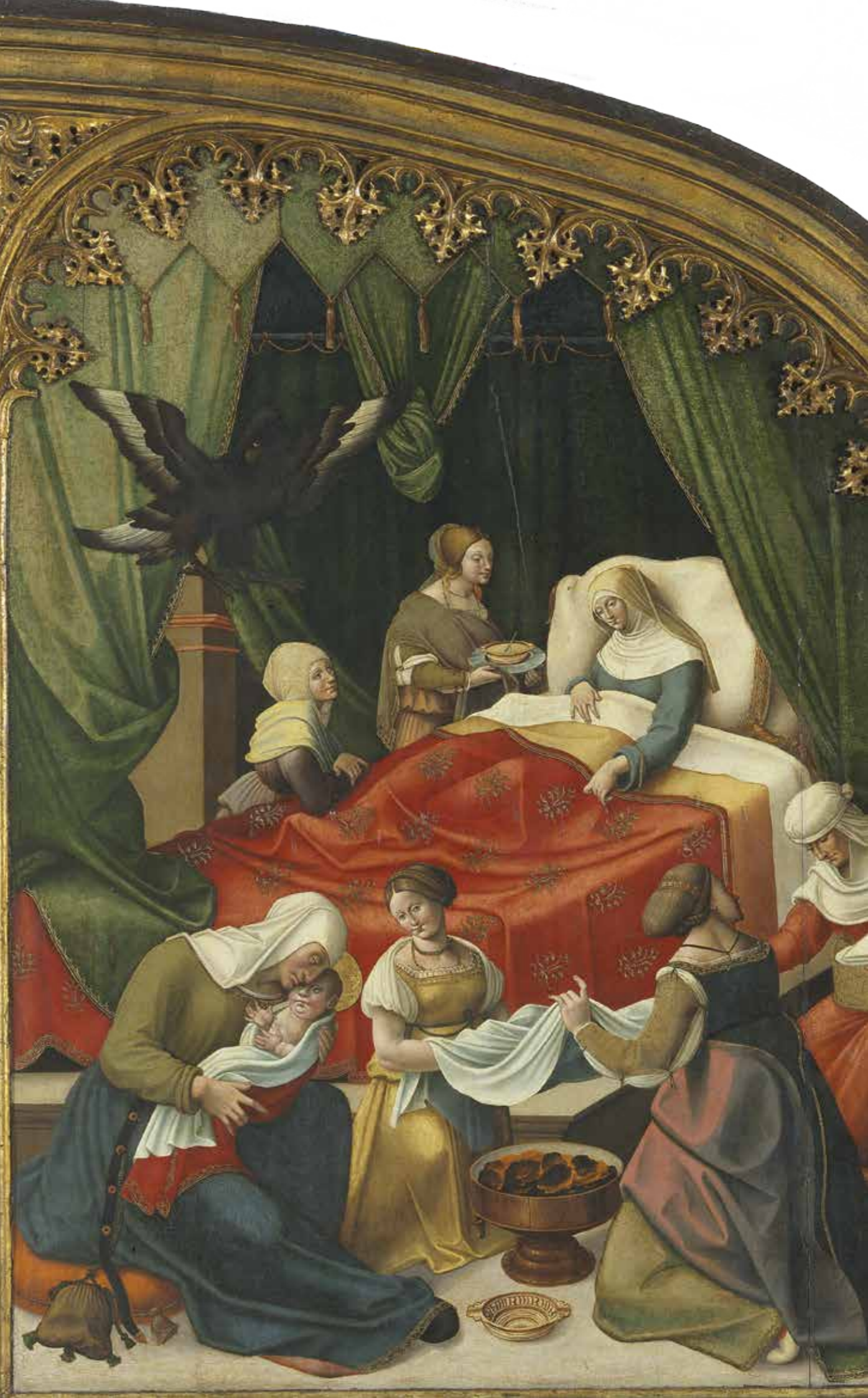
Pere Nunyes Naixement de sant Eloi Oli sobre taula 1526-1529 MNAC 024254-000

El dormitori benestant el contrastem amb el llit que utilitzaren durant segles les monges al dormidor comunitari de Pedralbes. És del model senzill de peus de gall amb màrfega de palla.